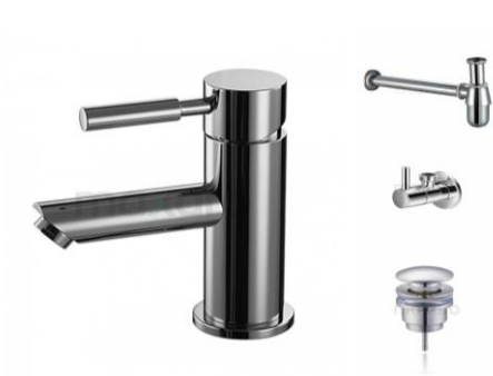
Varono Waschtischarmatur Serie Cinqua 55.003.561