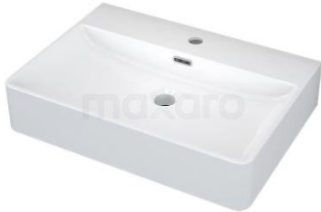
Keramikwaschbecken eckig 60,5x42x12cm Moccori