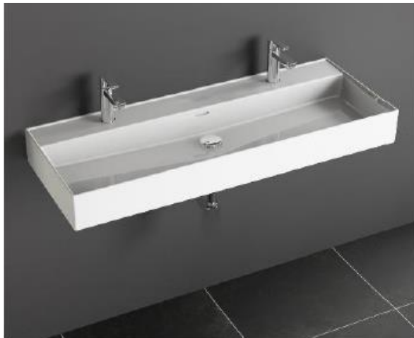
Doppelwaschbecken 120x47 cm