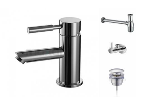
Varono Waschtischarmatur Serie Cinqua 55.003.561