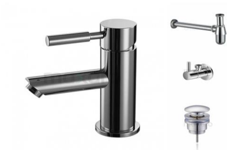
Varono Waschtischarmatur Serie Cinqua 55.003.561