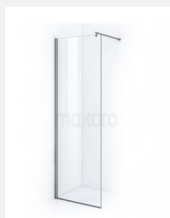
DUSCHGLASTRENNWAND Moccori ESG 120x200cm inkl. Stabilisationsstange. Boden Befestigung mit U-Profil Wandbefestigung Profil Verstellmöglichkeit 15mm Inkl. NANO-TECH Beschichtung innen und außen.