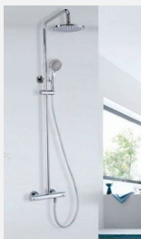
BRAUSEARMATUR-SET Cinqa DSA-5502-00000 mit Einhebelmischer Brausestange höhenverstellbar, Brauseschlauch Twist free