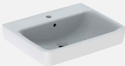
KERAMIK-WASCHBECKEN Moccori eckig 60,5x42x12cm mit Überlauf